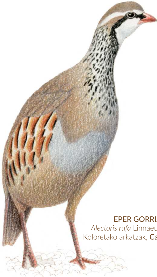
EPER GORRIA Alectoris rufa Linnaeus, 1758 Koloretako arkatzak, Carles Puche