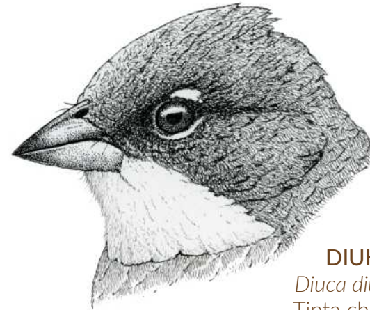
DIUKA ARRUNTA Diuca diuca Molina, 1782 Tinta china, Carles Puche