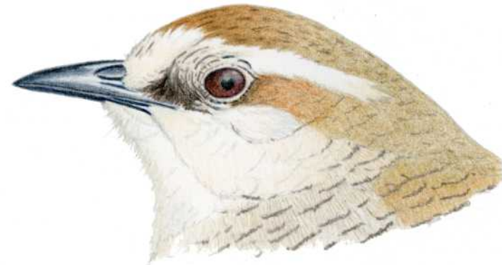
TAPAKULUA Scelorchilus albicollis Kittlitx, 1830 Koloretako arkatzak, Carles Puche