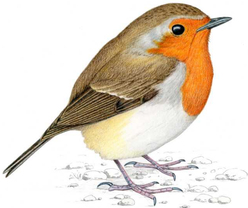
TXANTXANGORRI EUROPARRA Erithacus rubecula Linnaeus, 1758 Koloretako arkatzak, Carles Puche

Marrazten jardutea natura behatzeko eta naturari buruz ikasteko modu zoragarria da; eta, aldi berean, natura beti izan da -eta izango da- arte-maitaleen inspirazio-iturri.