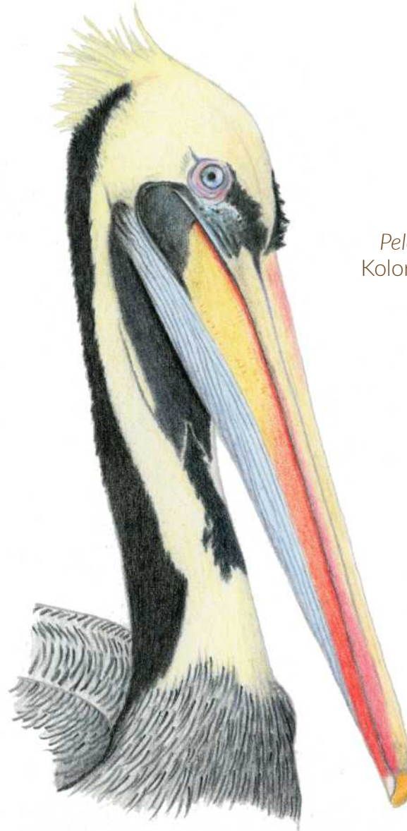
PELIKANO PERUARRA Pelecanus thagus Molina, 1782 Koloretako arkatzak, Carles Puche